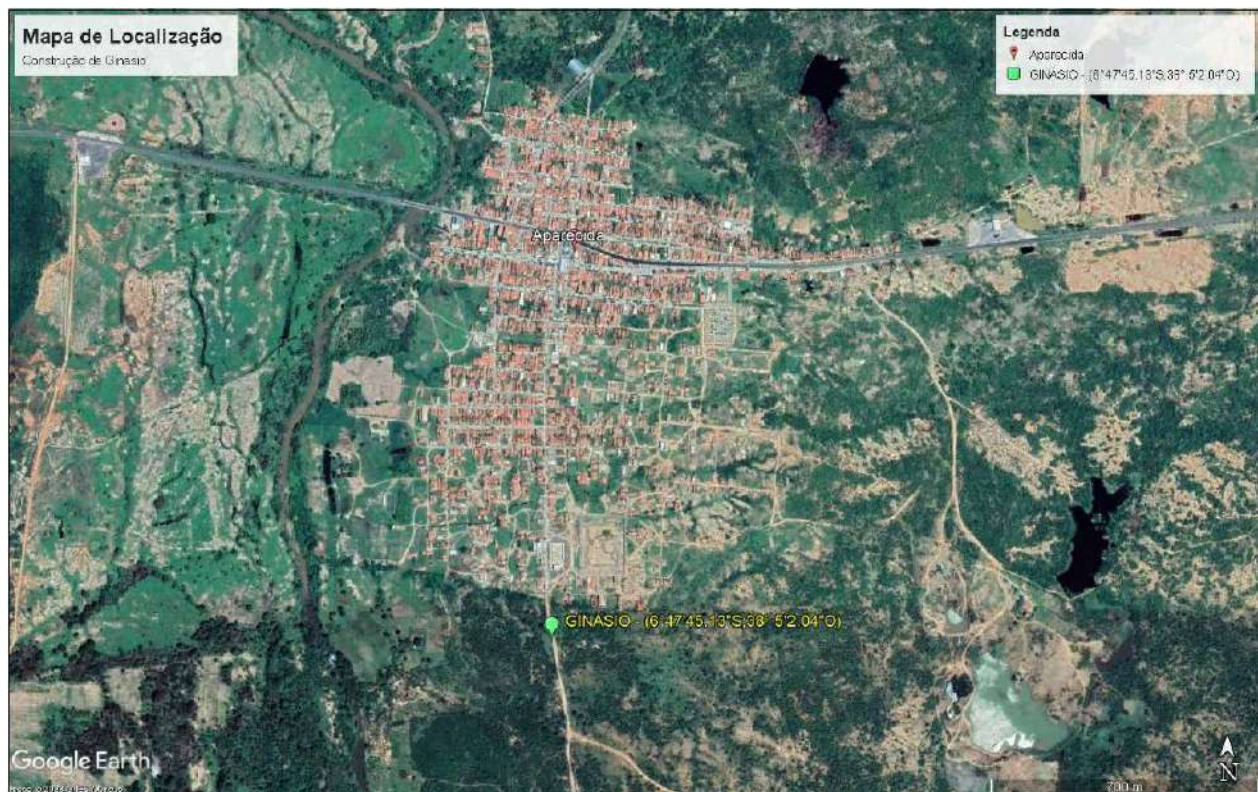
Imagem 1: Mapa de Localização